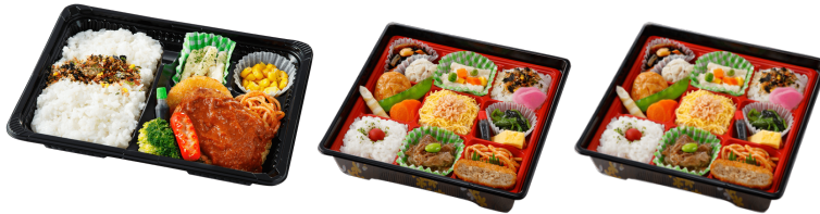
日替わりです。イメージです